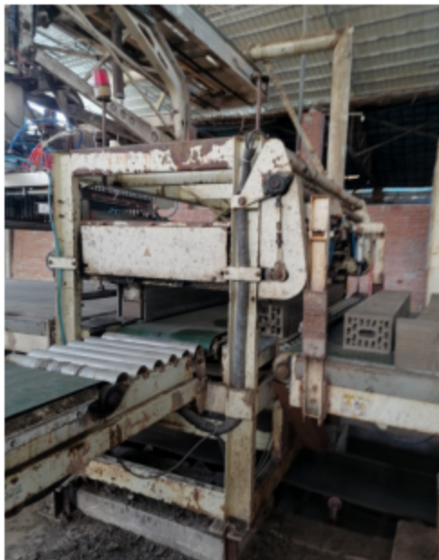
图3 事故区域远景照片

事故发生具体区域位于码坯车间的重型切坯机里面，具体见图3、图4。涉及事故设备为重型切坯机，其外框长×宽×高：2650mm×1680mm×1890mm，内部空间长×宽×高：1950mm×700mm×870mm，功能是把泥条切成坯状，不属于特种设备。根据调查，事故发生前设备能运转。