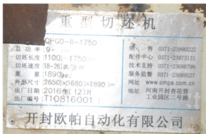
图 5 涉事重型切坯机铭牌