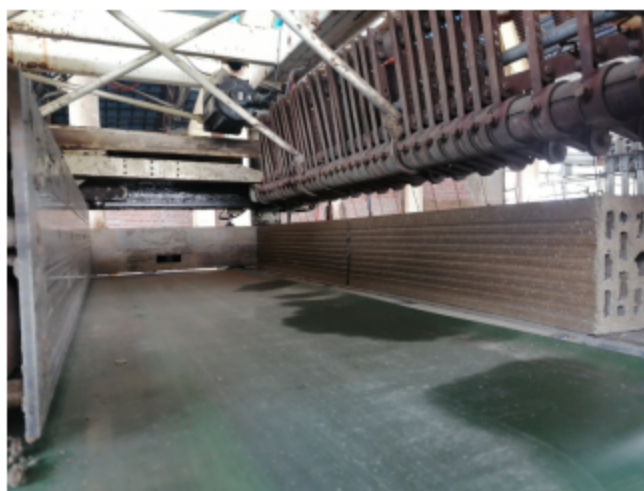
图4 涉事重型切坯机内部照片