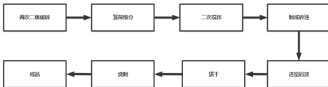
图1 恒隆公司工艺流程示意图